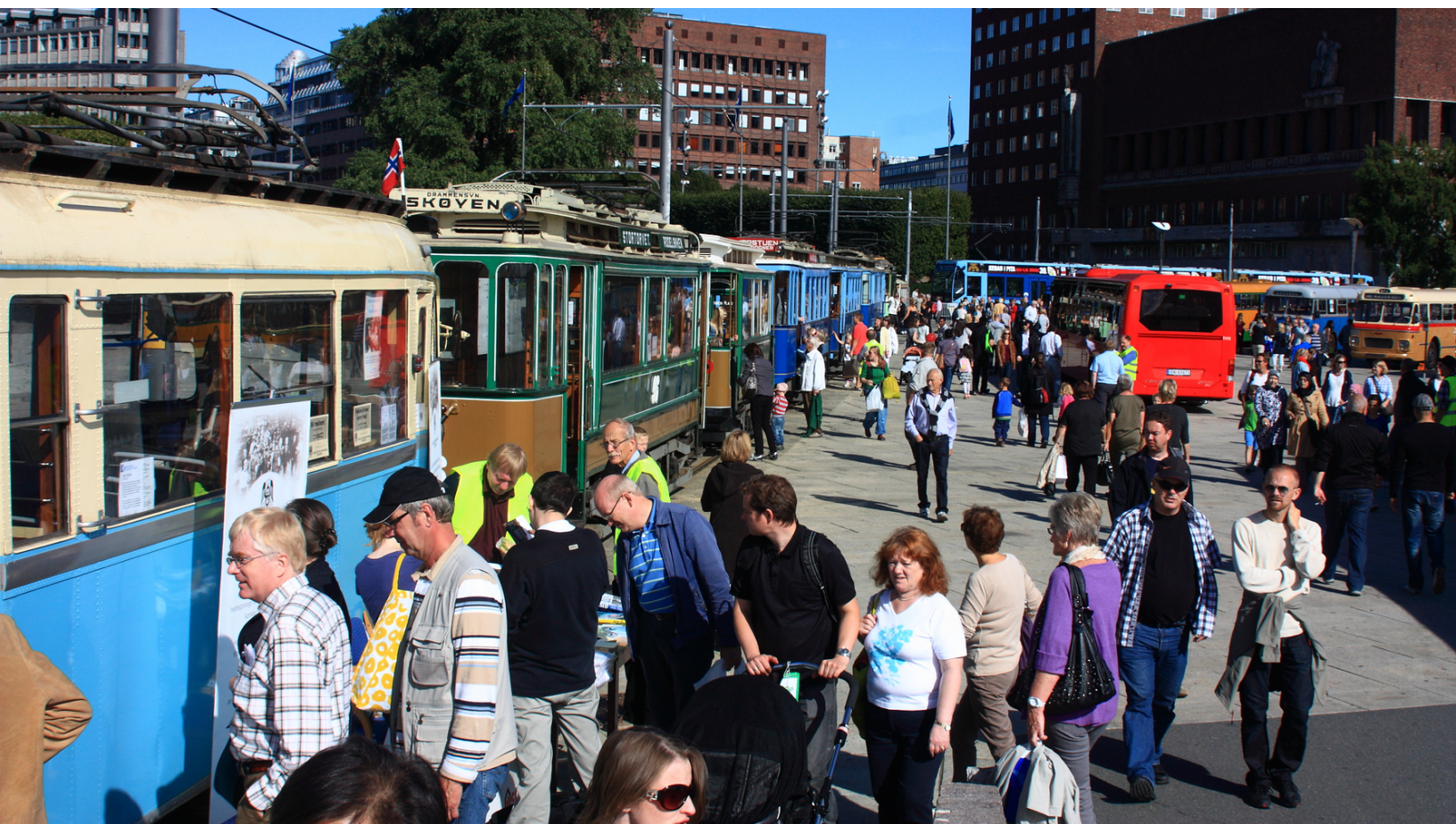
Bildet er fra Kollektivtrafikkens dag på Rådhusplassen i 2011.