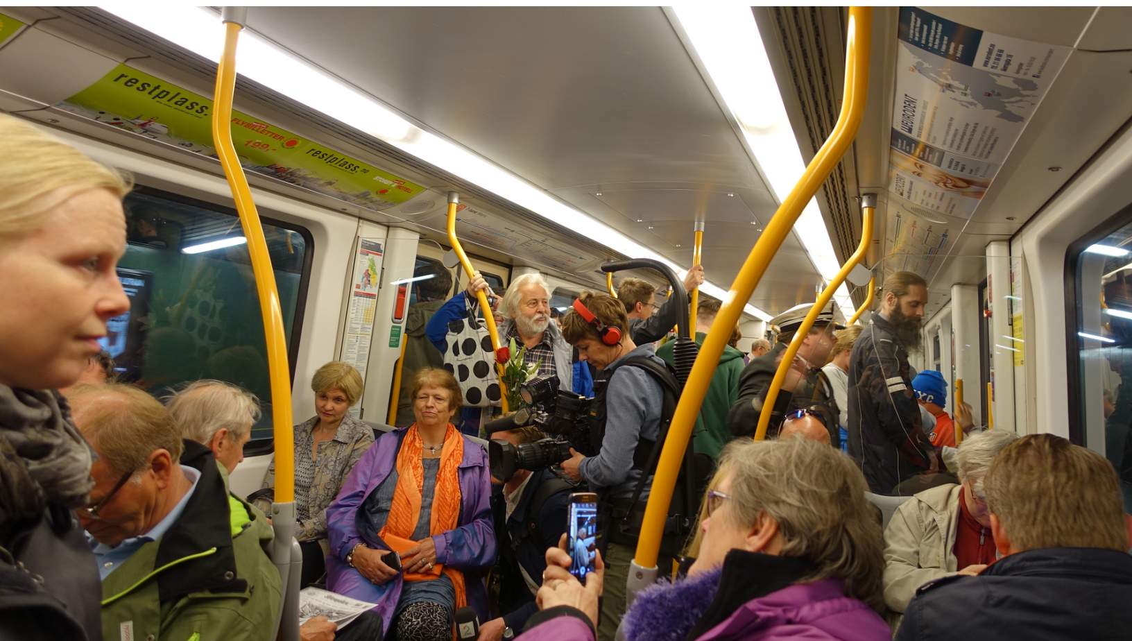
Jubileumstoget fra Stortingen til folkefesten på Bergkrystallen 22. mai 2016.