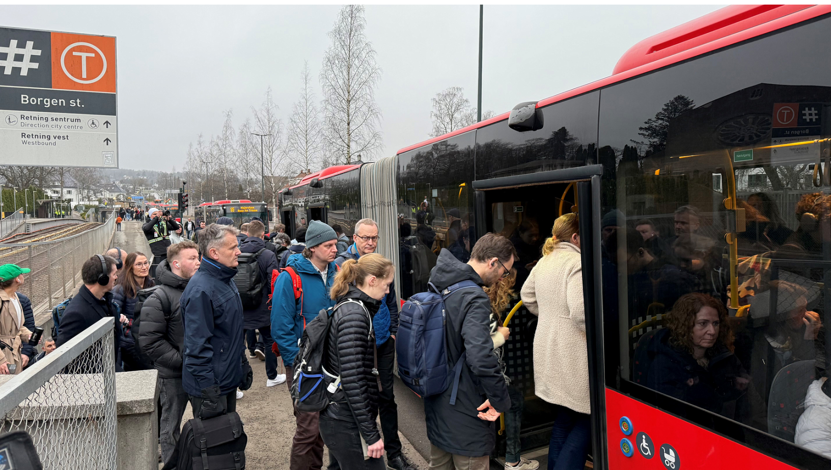
Borgen stasjon fredag morgen.