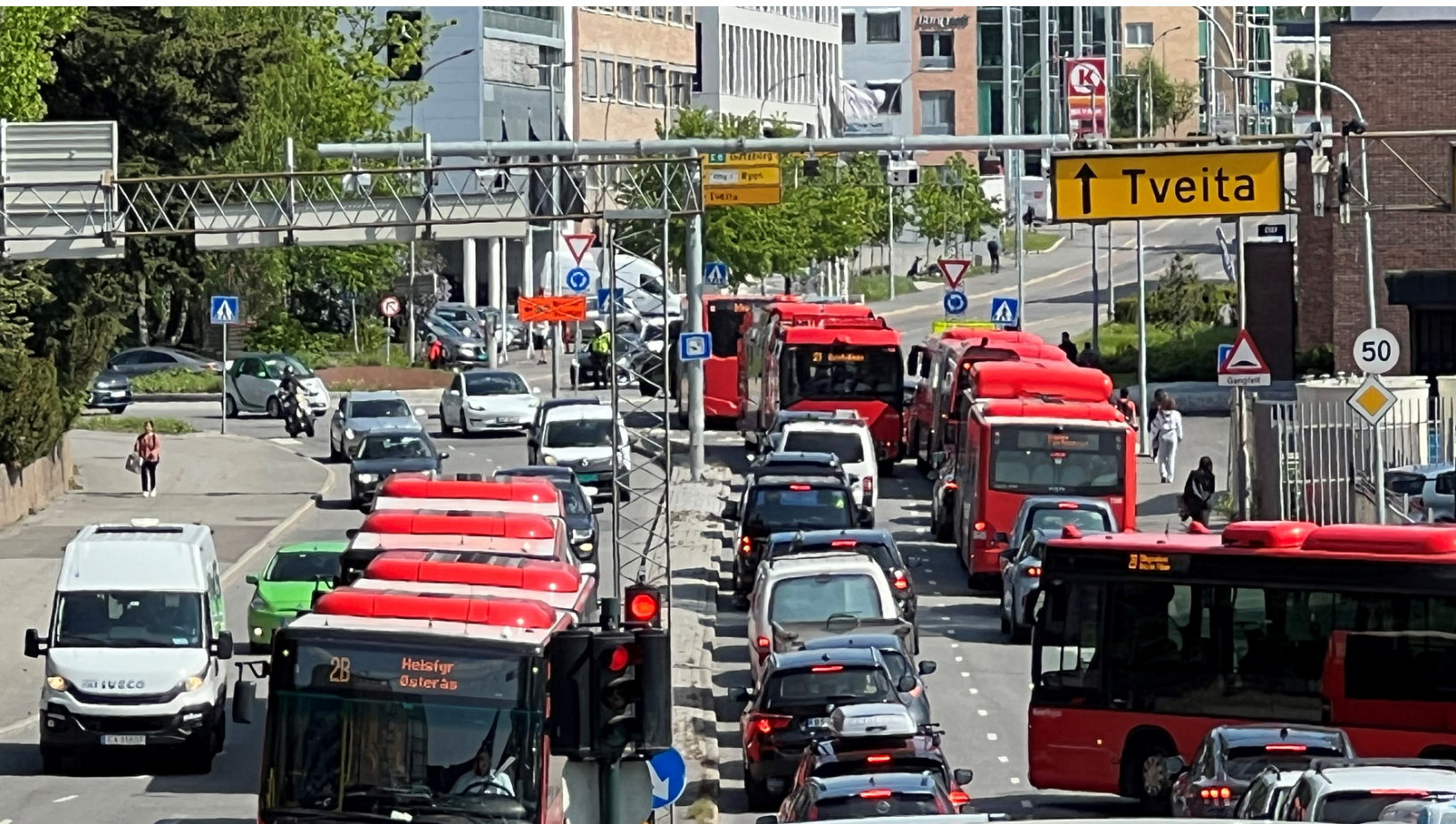
Mye trafikk skaper vanskeligheter for reisende fra Helsfyr, nå stenges sideveier og det innføres venstresvingforbud.